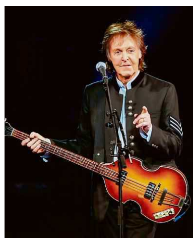
Paul McCartney in 2017.

LICHTENVOORDE De kaartjes voor de Zwarte Cross waren zaterdag weer in rap tempo uitverkocht. De campingkaarten en de zaterdagtickets waren zelfs binnen een kwartier allemaal weg. Het festival vindt volgend jaar plaats van 16 tot en met 19 juli. Ook de verkoop van tickets voor Pinkpop ging zaterdag van start. Volgens festivalbaas Jan Smeets zijn de helft van de kaarten verkocht. Pinkpop wordt van 19 tot en met 21 juni voor de 51ste keer gehouden. Een van de bands is de Red Hot Chili Peppers.